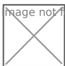
Tabela de DSR